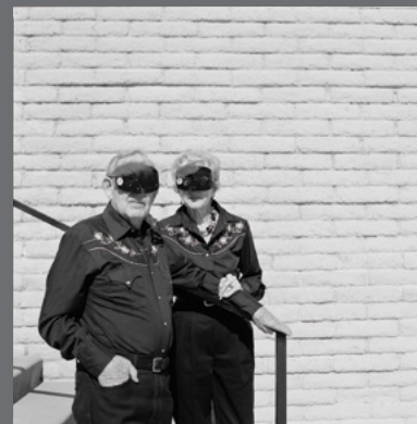
IMAGEN DE CUBIERTA