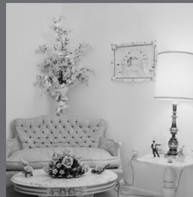
IMAGEN DE CUBIERTA