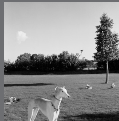
IMAGEN DE CUBIERTA