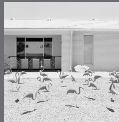
IMAGEN DE CUBIERTA