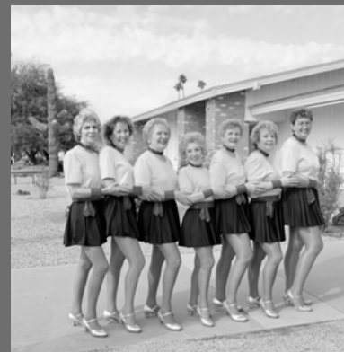
IMAGEN DE CUBIERTA

DISEÑO UNDERBAU IMPRESIÓN ESTUGRAF ISBN 978-84-9041-363-0 NIP0 827-19-002-1 DEPÓSITO LEGAL M-19229-2019 PRECIO 1 EURO