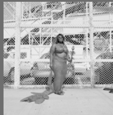
IMAGEN DE CUBIERTA