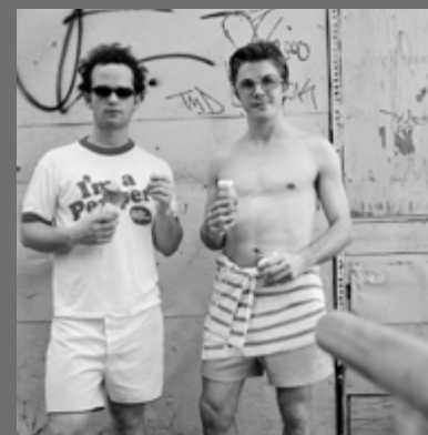
IMAGEN DE CUBIERTA