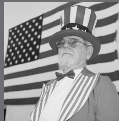
IMAGEN DE CUBIERTA