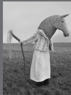
IMAGEN DE CUBIERTA