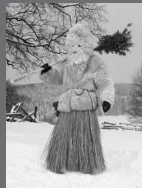
IMAGEN DE CUBIERTA