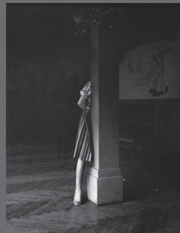
IMAGEN DE CUBIERTA