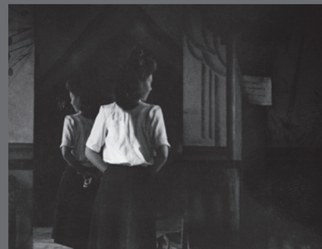
IMAGEN DE CUBIERTA