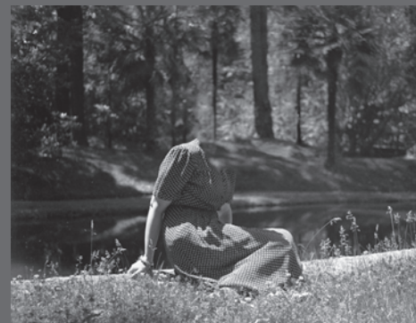
IMAGEN DE CUBIERTA