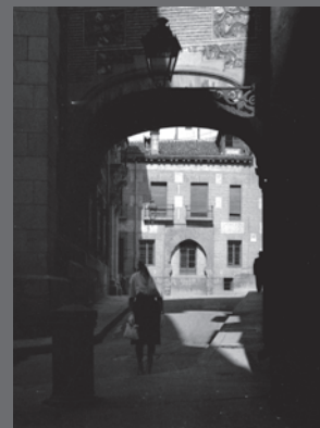
IMAGEN DE CUBIERTA