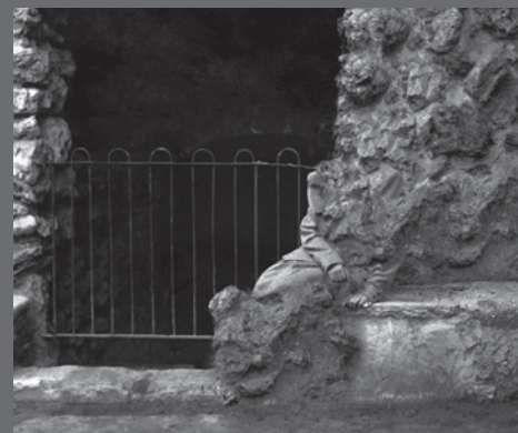
IMAGEN DE CUBIERTA