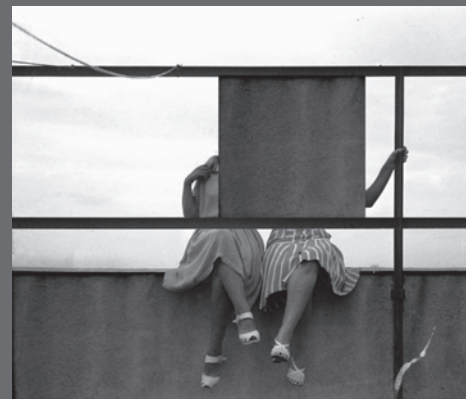
IMAGEN DE CUBIERTA