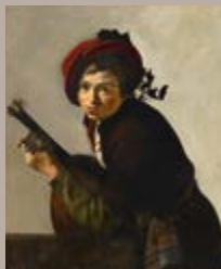
Jan Gerrit van Bronchorst

Joven tocando la tiorba (detalle), hacia 1642-1645