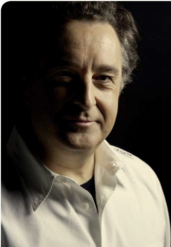
JOSEP PONS Director

Josep Pons ha ejercido el cargo de director artístico y titular de la Orquesta y Coro Nacionales de España (OCNE) desde 2003, liderando durante todo este tiempo una gran renovación artística; desde diciembre de 2011 es su director honorario. Actualmente la OCNE está considerada un estándar de calidad y programación. Sus próximos compromisos con esta institución incluyen la grabación de nueve CD hasta el 2013 con Deutsche Grammophon, así como diversas giras por toda Europa y Asia.