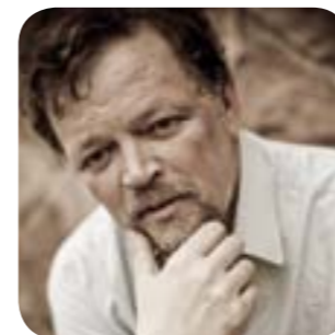
Nikolai Demidenko , piano Jiří Bělohlávek , director Sergei Rachmaninov : Concierto para piano y orquesta núm. 2, en do menor, opus 18 27, 28 y 29-V-2011