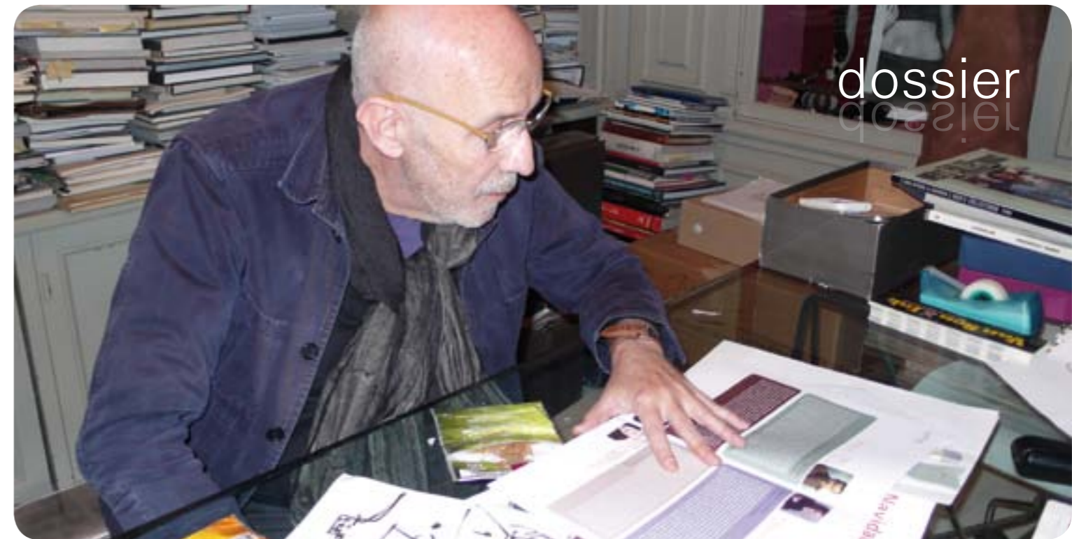
El modisto en su estudio de Barcelona

Aunque su trayectoria profesional se ha centrado principalmente en el mundo de la moda, son destacadas las frecuentes incursiones en otros ámbitos creativos: decoración de interiores, música, orfebrería, creación de esencias, complementos, etc., siempre avalado por un reconocimiento internacional materializado en múltiples premios y galardones, entre los que se encuentran el premio Cristóbal Balenciaga 1988 al mejor diseñador español, medalla Fad, otorgada por la Asociación de Diseño Industrial del Fomento de las Artes Decorativas, y la Medalla Antoni Gaudí, Moda Barcelona 2003, de la Pasarela Gaudí. Fue el encargado de diseñar el vestuario de las Ceremonias Olímpicas de Barcelona 92.